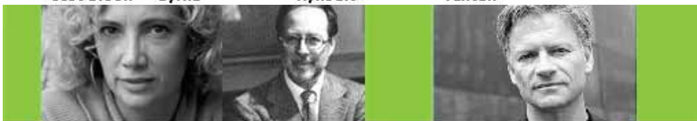
Carme Pinós · Francesco Venezia · Roger Diener