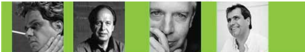
Lars Spuybroek · Boris Podrecca · David Chipperfield · Manuel Aires Mateus