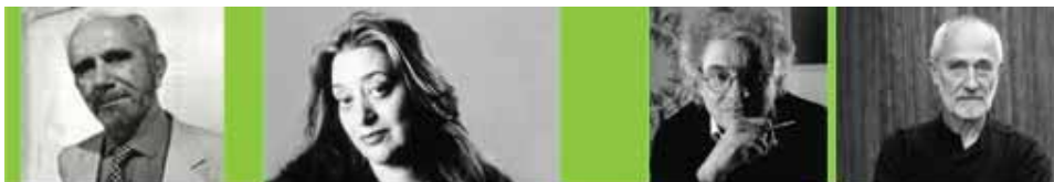
Aimaro Oreglia d'Isola · Zaha Hadid · Mario Botta · Peter Zumthor