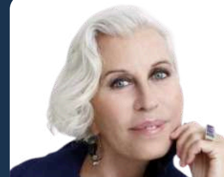
CHIARA BONI FASHION DESIGNER